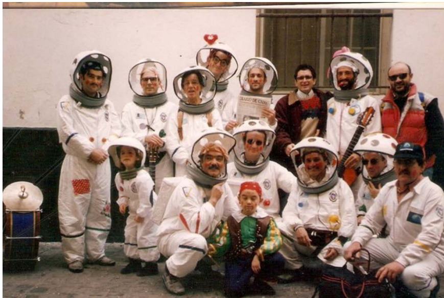
“Los astronautas españoles”

Pasamos al año 1996 y este año deciden probar suerte en el Concurso del Gran Teatro Falla con “ Los astronautas españoles ”. Creo que no fueron bien tratados por el jurado de ese año, pues considero que deberían haber llegado más arriba, pues llevaban un repertorio muy original y una música exquisita.