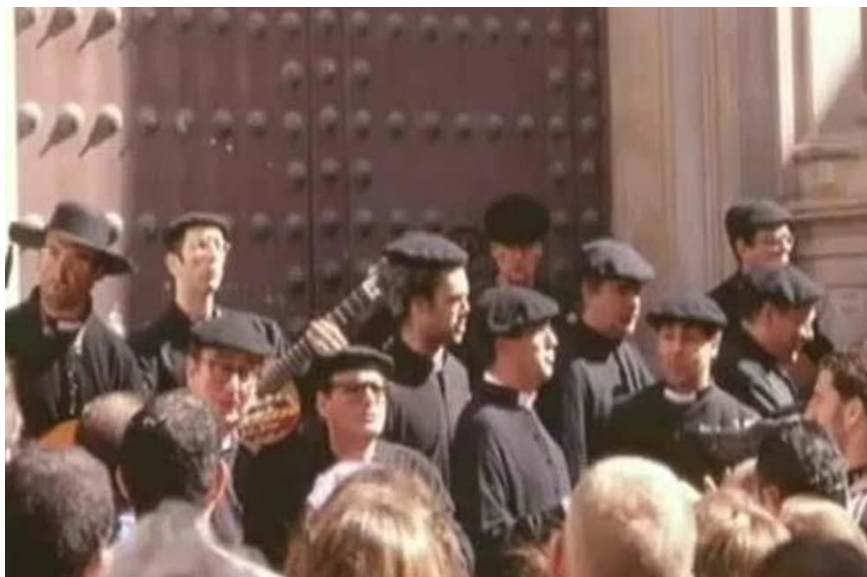
“Los curas de pueblo”

En el año 2000 nos deleitan con un gran pelotazo, pues se disfrazan de sacerdotes en sotana y se hacen llamar “ Los curas de pueblo ”, con la misma autoría de “Los Guillermitos”, y con un gran repertorio que gustó muchísimo.