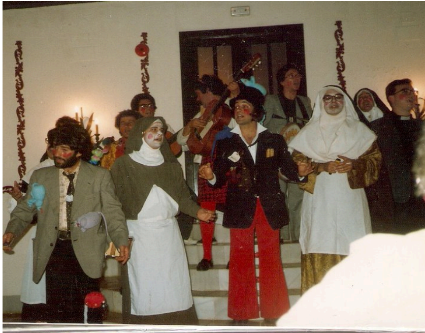
“Seis ratas por habitante”