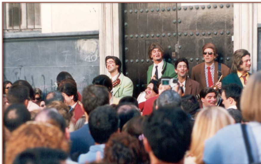
“Los alegres divorciados”

En 2002 “ Los alegres divorciados ”, el nombre ya lo dice todo, y en la presentación lo explican claramente y con mucho arte,