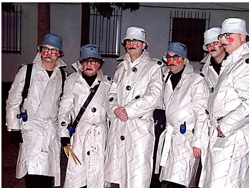
“la G.I.A.” (Guatifo Intelligence Agency)”

En 2009 se llaman “La G.I.A. (Guatifó Intelligence Agency)”, unos espías muy particulares. Destacar del tipo la gabardina de papel de estraza y el periódico con dos agujeros para fisgonear.