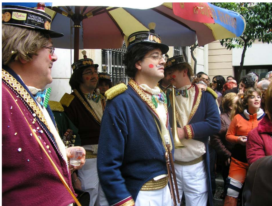
“El Gran circo guatifó”

En 2007 “El gran circo guatifó”, otra magnífica chirigota disfrazada de músicos de un circo. Hay que destacar los complementos del tipo tan originales, como el gorro hecho de una caja de galletas y una brocha de afeitar y la pajarita que es un paquete de chucherías.