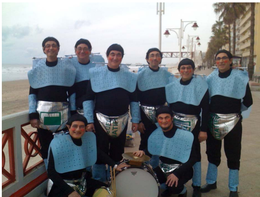
“Guatifalien (Los 8 pasajeros)”

En 2010 nos traen el tipo de extraterrestre y se hacen llamar: “ Guatifalien (los 8 pasajeros) ”. Destacar del tipo el peto confeccionado con una alfombra de baño y el pantalón con un parasol de coche.