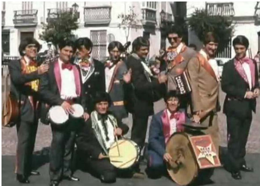
“Los hermanos Brothers y sus hermanos Catastrofic Music band”

En 1995 se disfrazan de banda de músicos callejeros, con el nombre de “ Los hermanos Brothers y sus hermanos Catastrofic Music band ”.